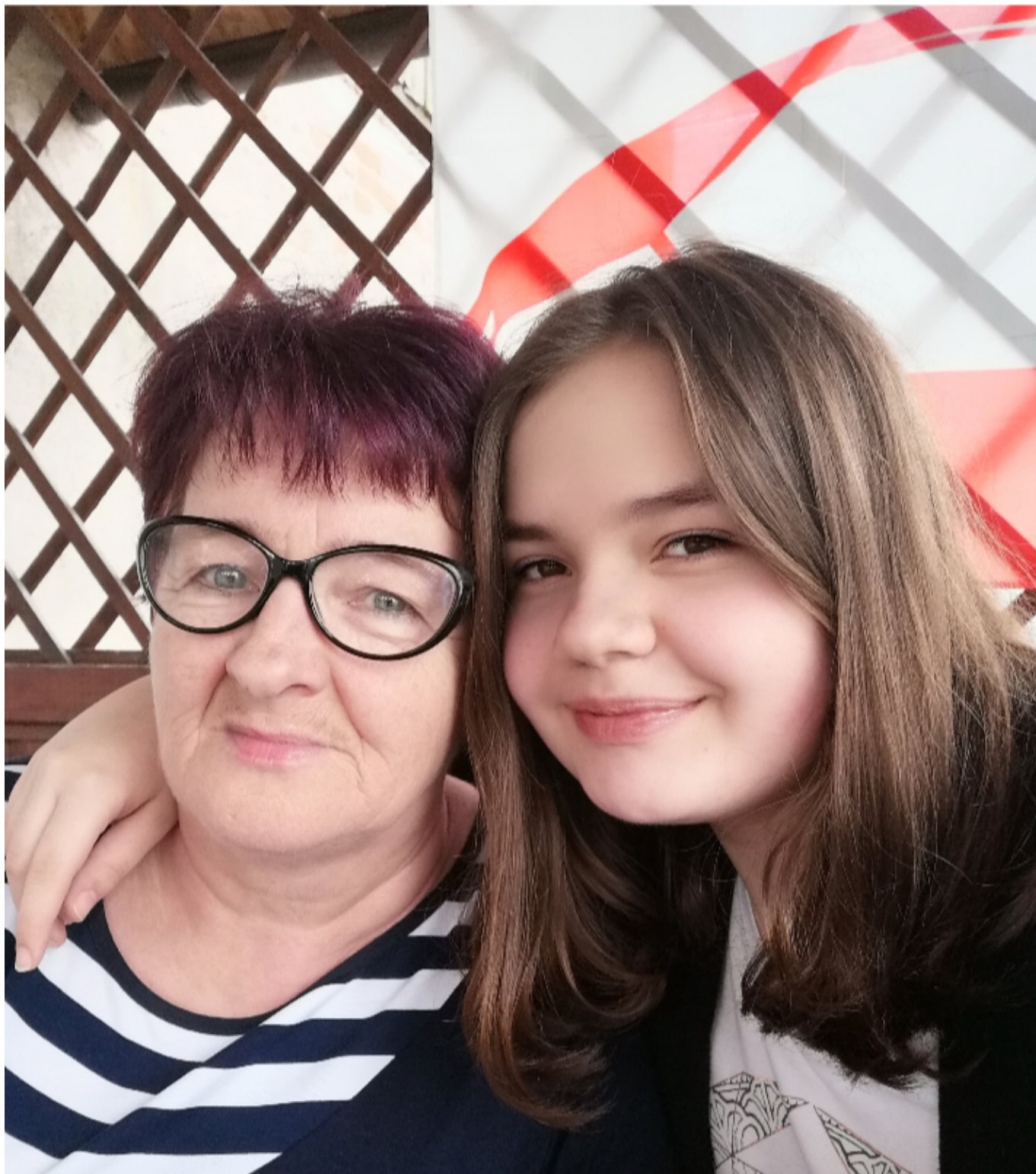
3. To moja najdroższa babcia. Gotuje najlepiej na świecie i co najważniejsze wiele dla mnie znaczy.