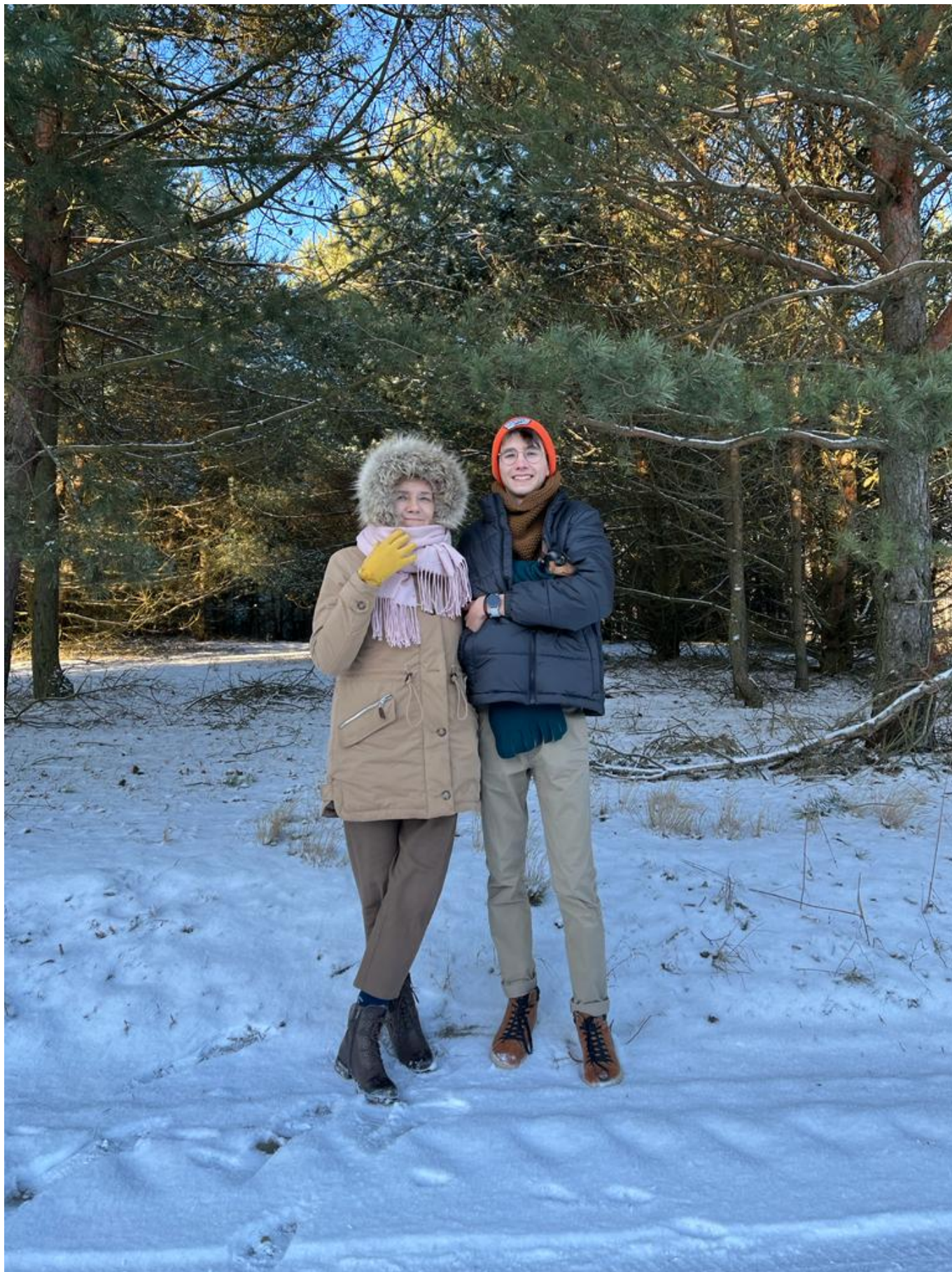
9. Moja babcia jest zawsze uśmiechnięta i wesola, życzę jej aby była taka zawsze:)