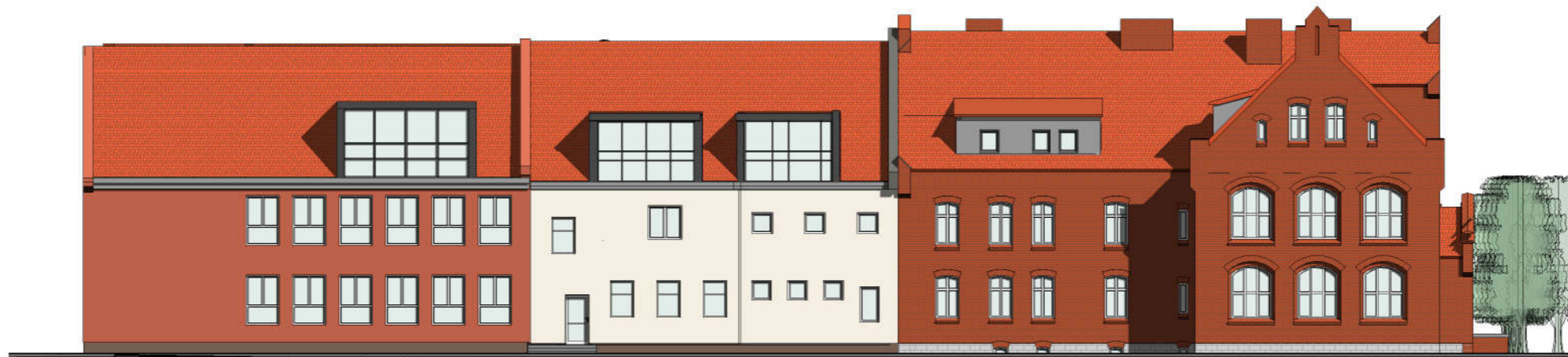
PROJEKTOWANA ELEWACJA ZACHODNIA