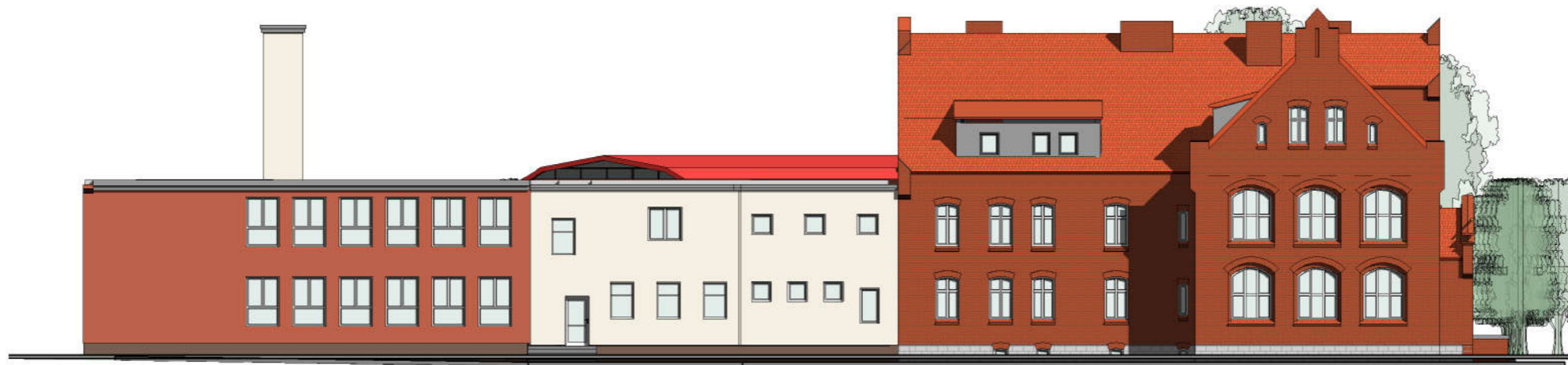
ISTNIEJĄCA ELEWACJA ZACHODNIA