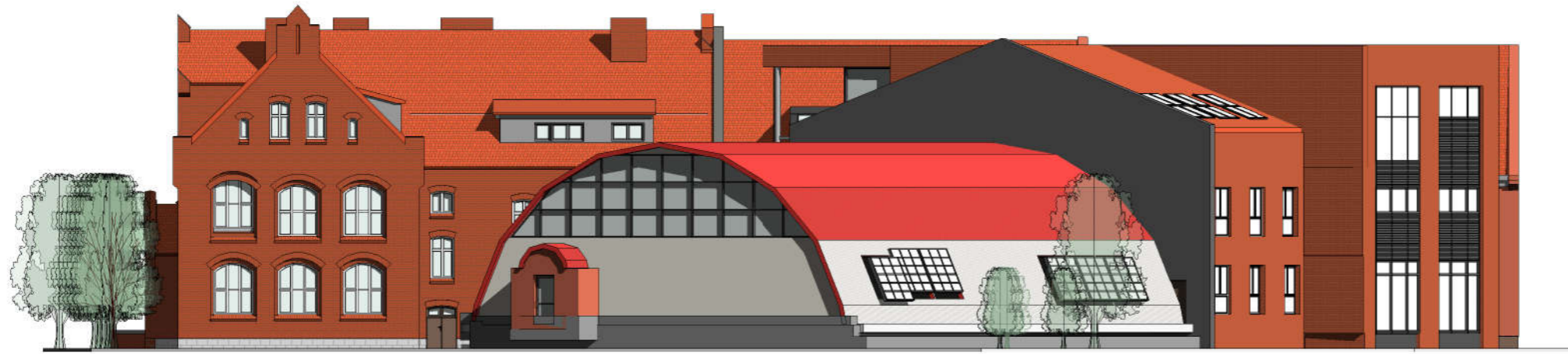
ISTNIEJĄCA ELEWACJA WSCHODNIA