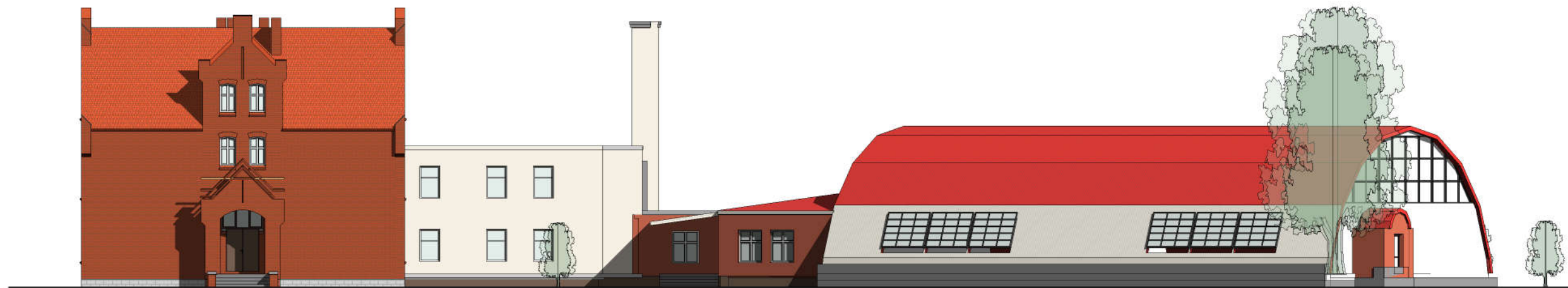
ISTNIEJĄCA ELEWACJA POŁUDNIOWA